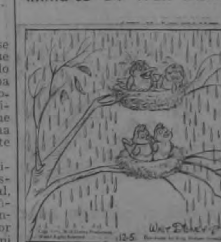
—“Lo que me enfurece es que se refieren a nosotros como SU techo”